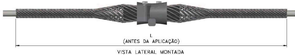
Figura 2 - Vista Lateral Montada

Linha de Negócio: Infraestrutura e Redes